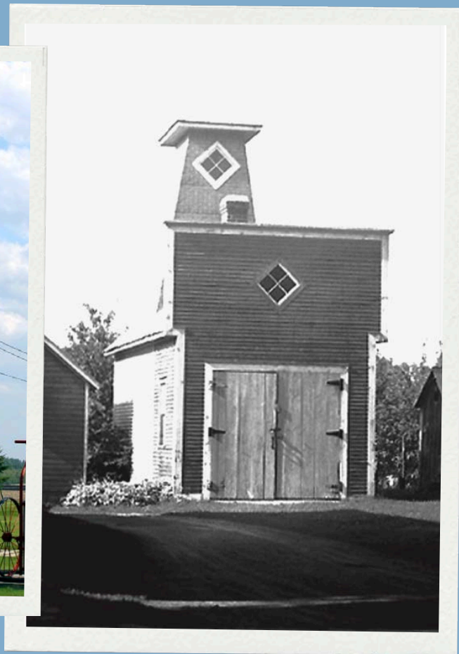
Ancien poste d'incendie transformé en espace muséal 574, route 202 Est, Hemmingford Canton.

Construite en 1884, remaniée en 1930 et déménagée en 2010.