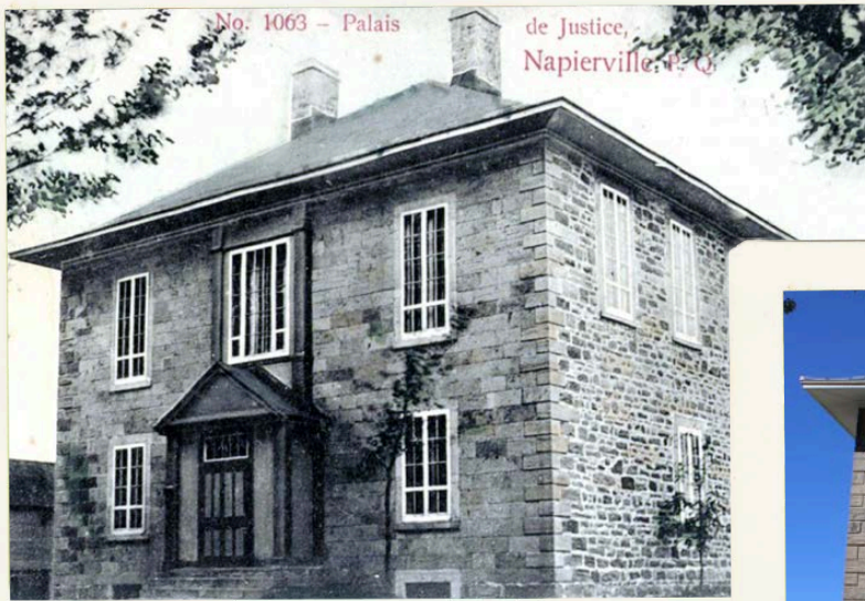
Palais de justice de Napierville, entre 1903 et 1914.