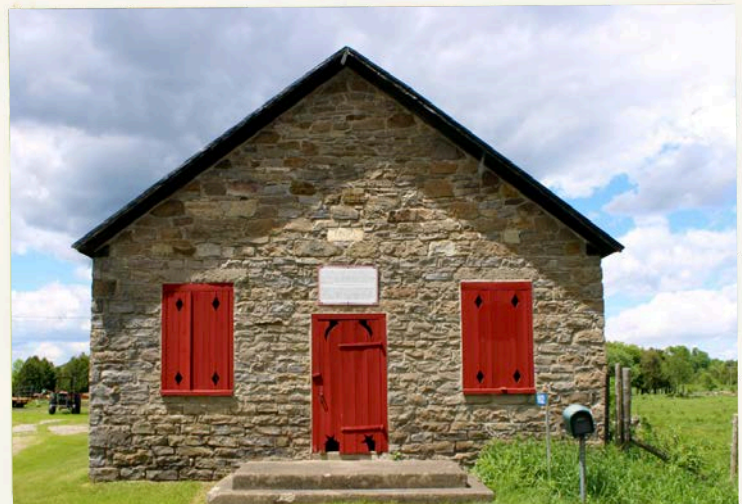
Ancienne école de rang convertie en centre communautaire, 162, rang Bogton Saint-Bernard-de-Lacolle.

Construite vers 1856, convertie dans les années 1950 et restaurée en 2012.